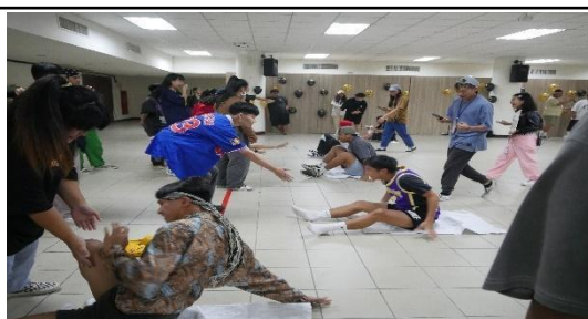
家族對抗賽-屁屁接力嚙