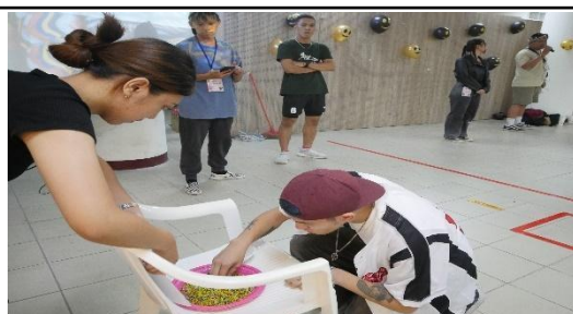
家族對抗賽-anema tja kanent吃什麼?